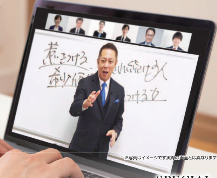
※写真はイメージです実際の画面とは異なります。