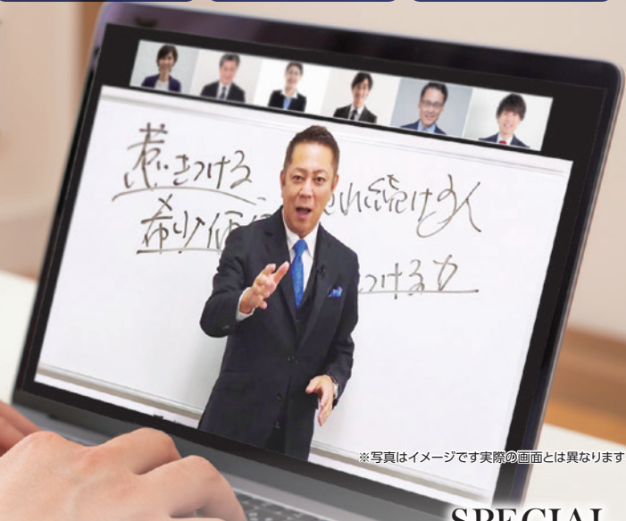
※写真はイメージです実際の画面とは異なります。